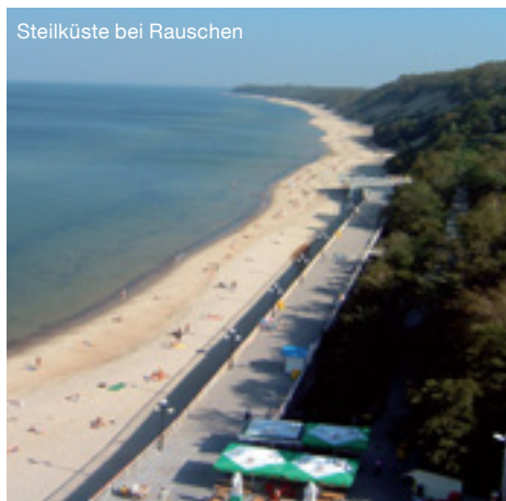
Steilküste bei Rauschen

Weiterreise nach Osten. In Labiau passieren Sie die Deime-Mündung. Von hier lohnt sich ein Ausflug am Großen Friedrichsgraben entlang bis in das verträumte Dorf Gilge am gleichnamigen Fluss. Anschließend Fahrt bis nach Tilsit. Nach