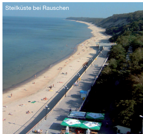
Steilküste bei Rauschen

Weiterreise nach Osten. In Labiau passieren Sie die Deime - Mündung. Von hier lohnt sich ein Ausflug am Großen Friedrichsgraben entlang bis in das verträumte Dorf Gilge am gleichnamigen Fluss. Anschließend Fahrt bis nach Tilsit. Nach dem Hotelbezug nutzen Sie den Nachmittag für einen Spaziergang in Tilsit. Auch heute